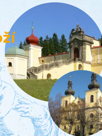
Klášteř na Hoře Matky Boží patří řádu redemptoristů. V areálu najdete mj. Památník obětem internace – Králíky

Od poutního „kostelíčka“ Božího Těla vede zelená turistická značka, lemovaná Božími mukami , ke kostelu a faře sv. Vavřince v Rudě nad Moravou . Pokračováním po zeleném značení navštívíte kapli v obci Janoušově , kde vás ukazatel nasměruje modrým