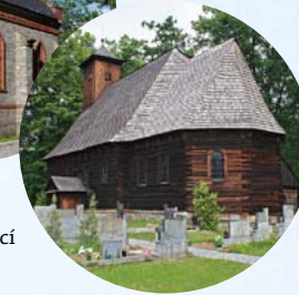
Unikátní dřevěný kostelík sv. Martina ze 17. století najdete v obci Žárová