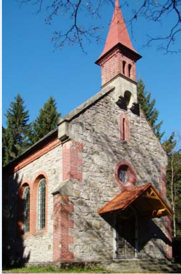
Kamenná poutní kaple Svatá Trojice se nalézá v nadmořské výšce 862 m

obrazu z Říma „Santa Maria Maggiore“ a tehdejší Lysou horu nechal přejmenovat na Horu Matky Boží. Z Králík sem vede alej lemovaná sedmi šesti-bokými kaplemi . V areálu objektu naleznete ambity se vzácnými obrazy, sochami, oltáři a kryptou, expozici Památník obětem internace – Králíky a kapli Svatých schodů , které jsou replikou schodů z hradu Antonia, po kterých krácel před svým odsouzením Ježíš Kristus. Klášter v současnosti patří řádu redemptoristů, kteří pořádají lidové misie. Krásné výhledy z poutního místa si můžete vychutnat na nedaleké rozhledně vysoké 34,5 m nebo se můžete vydat na výlet k Mariánskému prameni , který je údajně léčivý. V sousedství poutního chrámu byl v roce 1993 znovu otevřen Poutní dům , který vám doporučujeme k ubytování i občerstvení (informace na ► www.poutnidum.cz ).