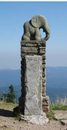
Kamenná socha slona - symbol Králického Sněžníku

zachovaná, jiná jsou v rozvalinách. Kapličku postavili obyvatelé Nového Rumburka roku 1887 a měla připomínat zázračné znovunalezení cesty ztracenou ženou. Při zdolání vrcholu Králického Sněžníku překročíte česko-polskou hranici a jděte po červené turistické značce do slavného polského poutního místa u Miedzygorze .