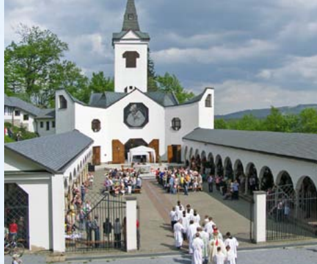
Maria Hilf, kostel zasvěcený Panně Marii Pomocné, patří k nejnavštěvovanějším poutním místům ostravsko-opavské diecéze

se dostanete po modré turistické značce nebo můžete zkusit obnovenou křížovou cestu, která vede od pomníku Anglický pramen ve Smetanových sadech. První zmínky o hornické kapli s obrazem sv. Anny pocházejí ze 17. století, kdy na Jesenícku probíhala intenzivní hornická činnost. Původně zde do 19. století stála dřevěná kaple, v té době přestala dostačovat stále stoupajícímu počtu věřících, a proto byla na jejím místě ve 40. letech 19. století vybudována z podnětu místního kaplana a za pomoci jeseníckých obyvatel v pořadí již třetí kaple sv. Anny, tentokrát zděná. Původní obraz nahradil dřevěný reliéf sv. Anny, sv. Jáchyma a Panny Marie. Pravidelně se zde pořádají poutě na svátek sv. Anny (červenec). V roce 1895 byla u kostela vybudována výletní hospůdka. V současnosti se zde nachází doporučovaná restaurace s ubytováním Křížový vrch , jejíž interiér se honosí výstavou loveckých trofejí fauny Jeseníků. V případě zájmu o ubytování nebo o ochutnání gastronomických specialit restaurace se informujte na ► www.krizovyvrch.cz .