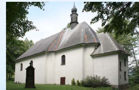
Barokní „kostelíček“ Božího Těla