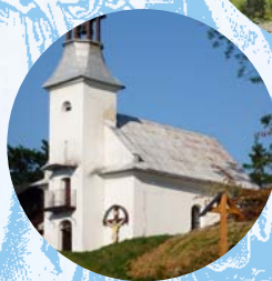
Křížový vrch u Jeseníku

Sobotín a jeho historie je spjata s těžbou železné rudy. V 19. století se stal důležitým centrem průmyslové revoluce, významnou roli při tom hrála rodina Kleinů. Velká část železáren se nedochovala, ale stopu po významném rodu najdeme v mauzoleu a na zámečku , který dříve plnil funkci zbrojovky. Nejvýznamnějším duchovním místem je v Sobotíně a okolí renesanční kostel sv. Vavřince z roku 1605. Po modré značce dojdete do místa bývalé osady