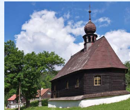
Dřevěný kostelík sv. Jana Nepomuckého stojí v centru osady Klepáčov

a na blízký vrchol Vozky a Spálený vrch. Podle pověsti je voda z Vřesové studánky zázračná. Ve 2. polovině 17. století byla u Vřesové studánky postavena kaple, která však vyhořela po zásahu blesku. V 19. století pak vedle pramene místní vystavěli kostelík, který byl ještě dvakrát obnoven, vždy však vyhořel a k jeho obnově poté již nedošlo. Na základech kostelíka byl v roce 1927 dočkal zastřešení v podobě kamenné kaple, jež stojí doposud. Hlavní pouť se zde koná v sobotu v měsíci září, při příležitosti památky Panny Marie Bolestné. Zajímavostí je, že v německém Weilersbachu (Bavorsko) a Kaisheimu stojí repliky kaple z Vřesové studánky.