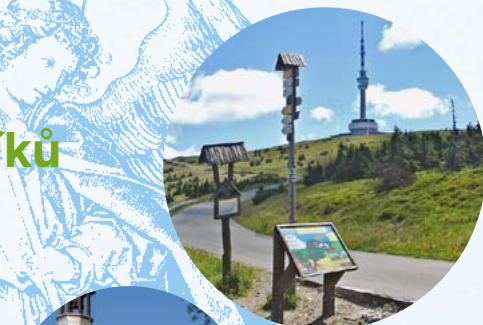
Rozcestník a odbočka ke Švýčárně. V pozadí televizní vysílač na Pradědu

Nejdější poutní cesta navazuje v horském sedle Skřítek na stezku ze Svatého Kopečku u Olomouce (ta vede přes další významné poutní místo, Křížový vrch v Rudě). Samotná stezka začíná opět ve Velkých Losinách (viz popis předchozího putování). Pouť zahájíte u kostela sv. Jana Křtitele a zavede vás po modré turistické značce k další dřevěné sakrální stavbě v okolí Velkých Losin, kostelu sv. Michaela v Maršíkově . Jde o cennou renesanční roubenou stavbu z roku 1609 s barokními a rokokovými úpravami. Po bitvě na Bílé hoře byl Maršíkov připojen k losinské faře a kostel sv. Michaela se stal filiálním kostelem. Po červeném značení směrem na Sobotín leží kaple Nejsvětější Trojice . Ke kapličce přiléhá přístřešek s pramínkem, dle místních obyvatel má pramen léčebné účinky. Po červeném značení pokračujte do obce Sobotín.