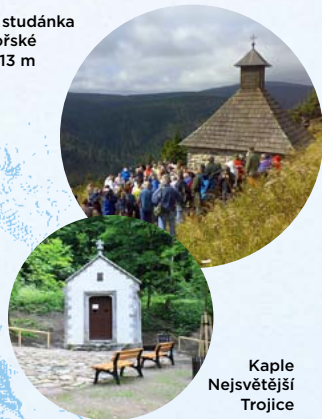
Kaple Nejsvětější Trojice