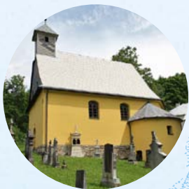
V obnovené hřbitovní kapli Nanebevzetí Panny Marie se příležitostně pořádají benefiční koncerty

V kapli jsou příležitostně pořádány benefiční koncerty. Mezi největší akce patří Pekařovská pouť , která se koná vždy v polovině srpna při příležitosti svátku Nanebevzetí Panny Marie. Pravidelně se této pouti zúčastňují flašinetáři připomínající někdejší světově proslulou manufakturu na varhany a flašiny. Více informací naleznete na ► www.vresovka.cz .