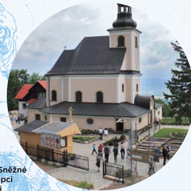
Poutní kostel Panny Marie Sněžné najdete na kopci Góry Iglicznej

pro bohoslužby katolické. Dřevo z původní stavby posloužilo k výstavbě dvou unikátních celodřevěných kostelíků v okolí – v Maršíkově a Žárově.