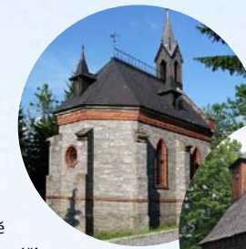
Kaple sv. Rocha stojí u silnice na Ramzovou

V kapli jsou příležitostně pořádány benefiční koncerty. Mezi největší akce patří Pekařovská pouť , která se koná vždy v polovině srpna při příležitosti svátku Nanebevzetí Panny Marie. Pravidelně se této pouti zúčastňují flašinetáři připomínající někdejší světově proslulou manufakturu na varhany a flašiny. Více informací naleznete na ► www.vresovka.cz .